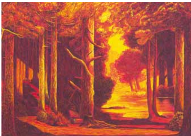
Martin Jacobson / Skogsstig, starkt ljus / 2012

Medlemsblad för Vänföreningen Nordiska Akvarellmuseet, september 2013.